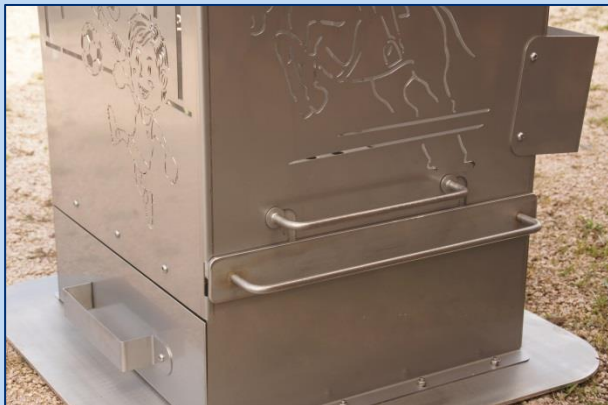
Unteres Kohlerost zum Herausnehmen.