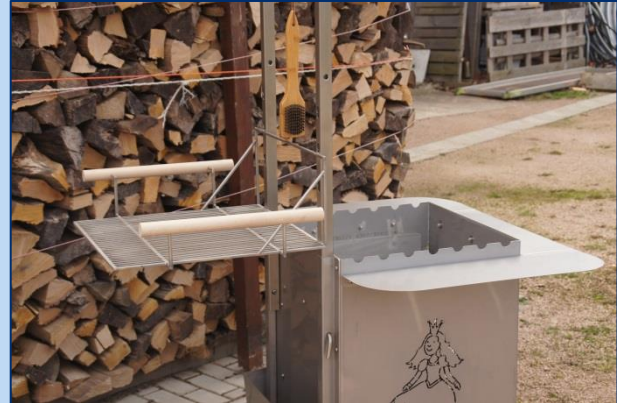
Aufbewahrungsmöglichkeit zubereiteter Speisen.