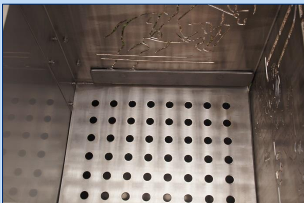
Unteres Kohlerost mit integriertem Aschabstreifer.