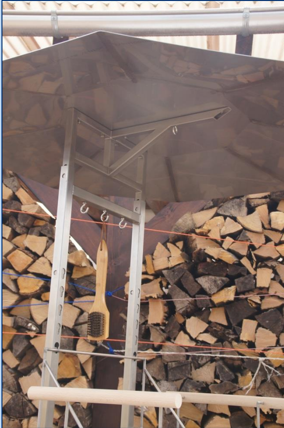
Grillüberdachung und Haken für Grillzubehör.