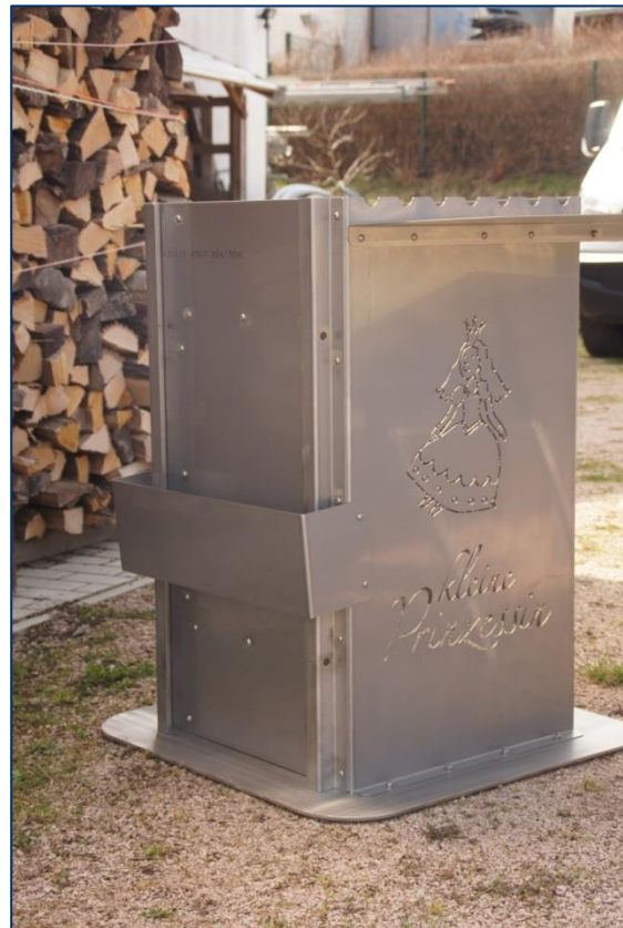
Beispielmotiv „Kleine Prinzessin“.

Wir fertigen Ihr Wunschmotiv nach einer Fotovorlage in hochwertigem Edelstahl. Bilder, Schriftzüge oder Firmenlogos ... fast alles ist möglich!