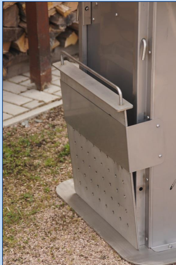
Haltevorrichtung zum Aufbewahren des Kohlerostes.