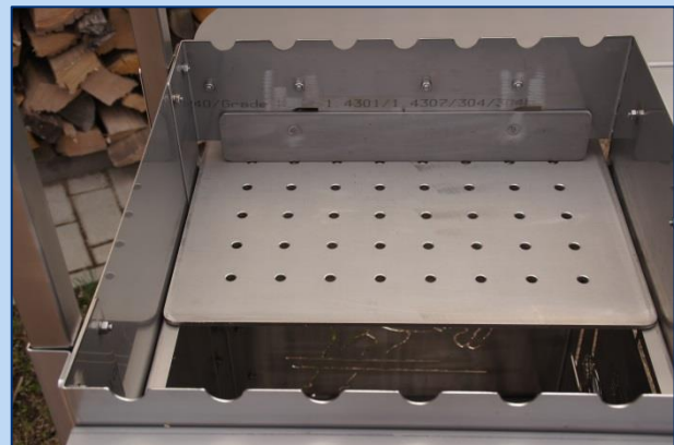
Oberes Kohlerost zum Herausnehmen.